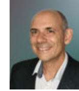
C. AUBIGNY Installations électriques MT réseaux privés NF C 13-100 et 13-200